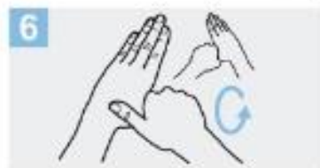
6 Frótese con un movimiento de rotación el pulgar izquierdo, atrapándolo con la palma de la mano derecha y viceversa;