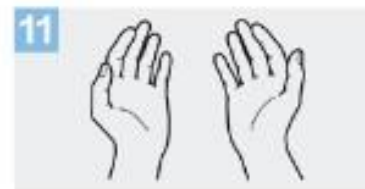
11 Sus manos son seguras.