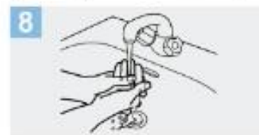
8 Enjuáguese las manos con agua;