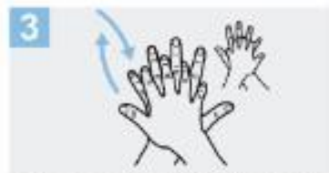
3 Frótese la palma de la mano derecha contra el dorso de la mano izquierda entrelazando los dedos y viceversa;