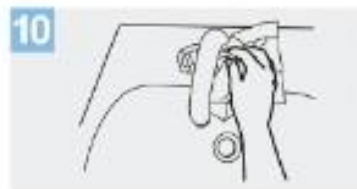
10 Sirvase de la toalla para cerrar el grifo;