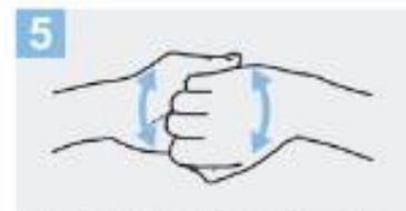
5 Frótese el dorso de los dedos de una mano con la palma de la mano opuesta, agarrándose los dedos;