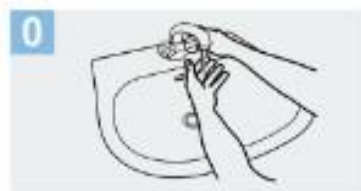
0 Mójese las manos con agua;

El lavado de manos requiere asegurar insumos básicos como jabón líquido o espuma en un dispensador, y toallas descartables o secadores de manos por soplado de aire. El lavado de manos con agua y jabón debe realizarse siguiendo los pasos indicados en la siguiente ilustración: