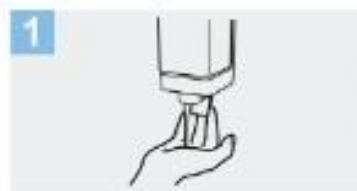
1 Deposite en la palma de la mano una cantidad de jabón suficiente para cubrir todas las superficies de las manos;