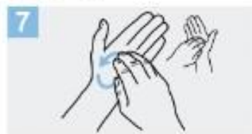
7 Frótese la punta de los dedos de la mano derecha contra la palma de la mano izquierda, haciendo un movimiento de rotación y viceversa;