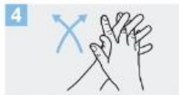
4 Frótese las palmas de las manos entre sí, con los dedos entrelazados;