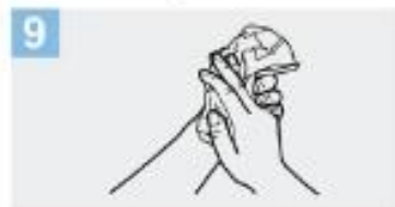
9 Séquese con una toalla descartable;