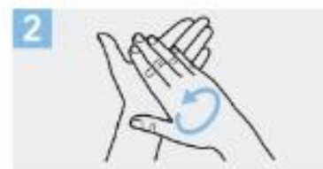
2 Frótese las palmas de las manos entre si;